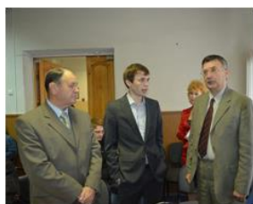
Обсуждение технических возможностей 3D принтеров